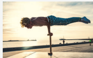
Figure sur la plage du Havre