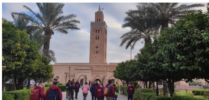
La Koutoubia et ses jardins

qui doit son nom aux ateliers de ferblanterie (artisanat d'outil en fer blanc) qui y sont installés, le Palais Bahia magnifique palais de style mauresque. Puis déambulation dans les souks, des marchés où on trouve de tout. Un endroit foisonnant de couleurs et d'odeurs. Des moments de la journée sont consacrés à des ateliers d'écriture pour commencer la rédaction du livre. Une visite du jardin Majorelle, labyrinthe d'allées de