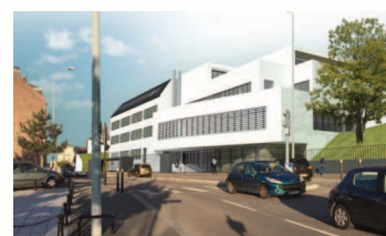
Entrée du site de Gaulle (projet)

Propos recueillis par Célya Hénaut, Sarah Morel, Camille Rousseau et Mathilde Boucher, 2C