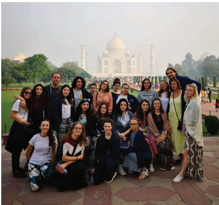
Les T ASSP et leurs professeurs devant le Taj Mahal