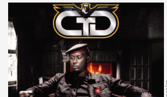
Empire, le 3e album de CTD