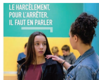
Campagne ministérielle contre le harcèlement scolaire