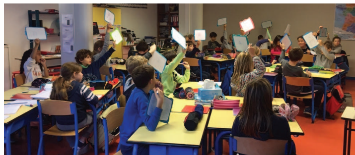
Les élèves présentent leurs réponses