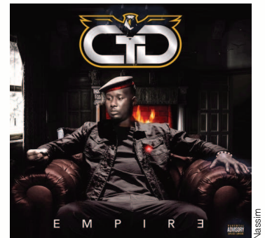
Empire, le 3e album de CTD

Propos recueillis par Nathan Chatelain et Giorgi Obgaidze, 2GTEB