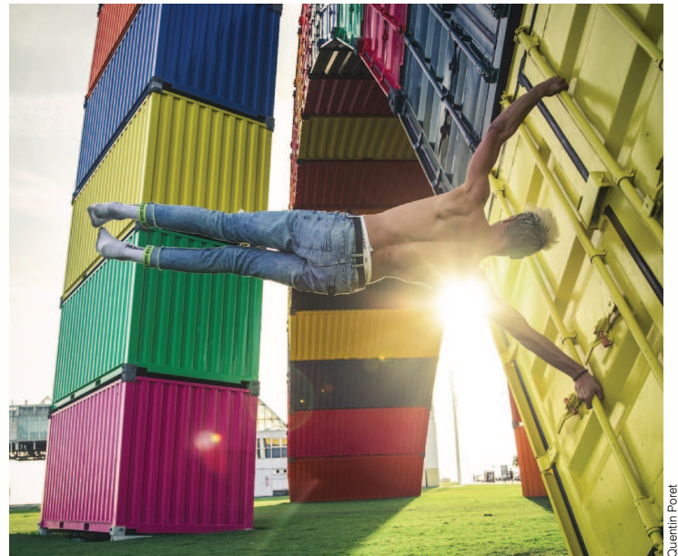
Figure exécutée par Quentin Poret, ancien élève de Jeanne d'Arc