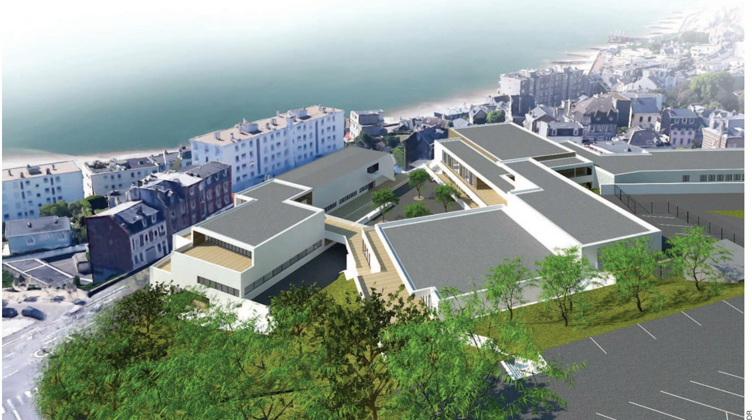
Vue aérienne du nouveau site de Gaule depuis la rue du Fort (projet)