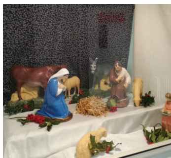
La crèche du bâtiment Les Gadelles

Emilie Varloteaux, Ludivine Hugueny - 1G1