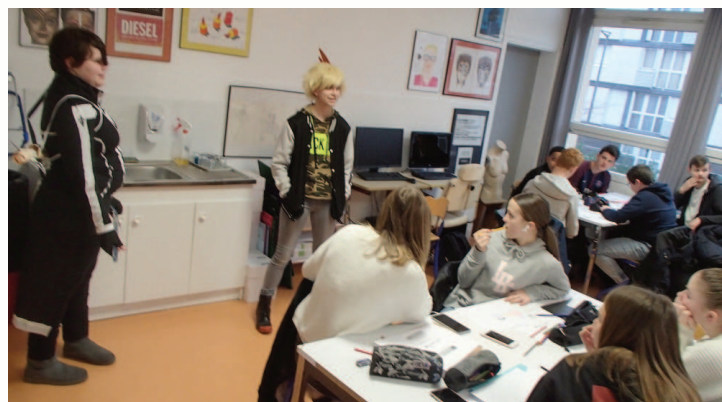
Présentation du Club manga aux camarades ravis