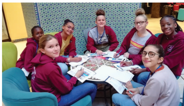
Atelier écriture pour remplir les carnets de voyage

L'aventure commence dès le vol jusqu'au Maroc : la vue du ciel est un enchantement. A leur arrivée à l'hôtel, les élèves commencent à écrire dans leur carnet de voyage ce qu'ils voient et ce qu'ils ressentent. Les habitants, l'architecture et la gastronomie sont l'objet de découvertes et d'admiration. Le premier jour, le groupe fait la connaissance de Mustafa, le guide qui les accompagnera dans les visites : la Médina, avec la mosquée de la Koutoubia, la place des Ferblantiers