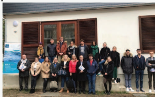
Devant la Narrow house