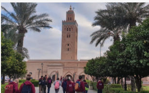
La Koutoubia et ses jardins