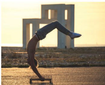
Street workout sur la plage du Havre

Le street workout allie musculation et gymnastique pour